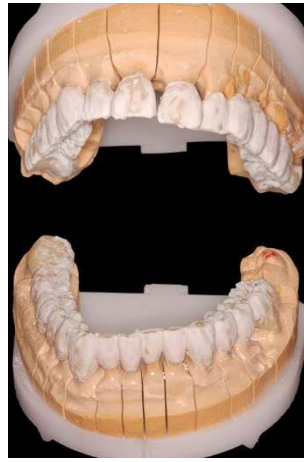
Korrektur des Keramikbrennen