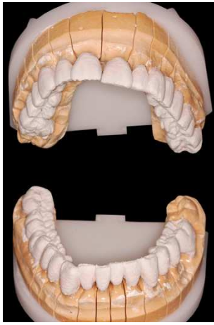
Auf die Zirkongrundlage aufgetragene ZR Keramik