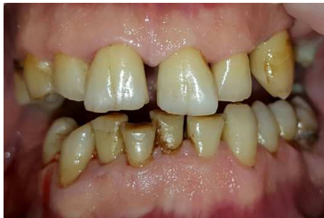
Situation vor dem Abschleifen