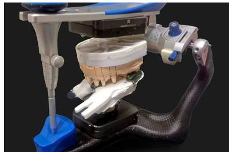
Positionierung des Mittels des Registrats artikuliert Modelle