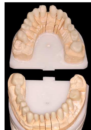
Modellen gesinterter Zirkon