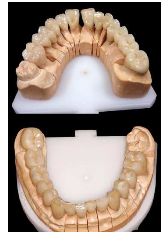
Vollendete Arbeit an dem Modell