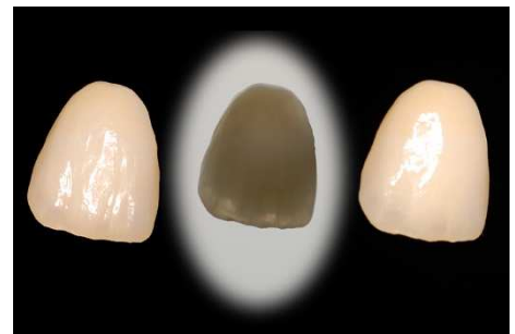
DER GLEICHE ZAHN IN VERSCHIEDENEN LICHTBEDINGUNGEN