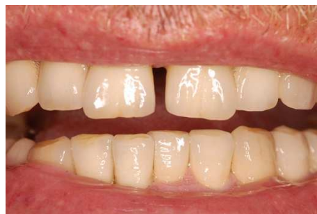
Vollendete Arbeit in dem Mund