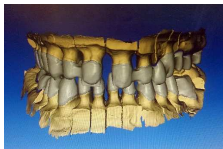
Design in CAD-Software